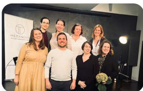
Inklúzia ako postoj k svetu - diskusia organizovaná Metanoia o.z.

V rámci Sloníkova sme mohli spolupracovať s rôznymi organizáciami a búrať tak predsudky o INAKOSTI, inklúzii a montessori pedagogike v Trnave a okolí.